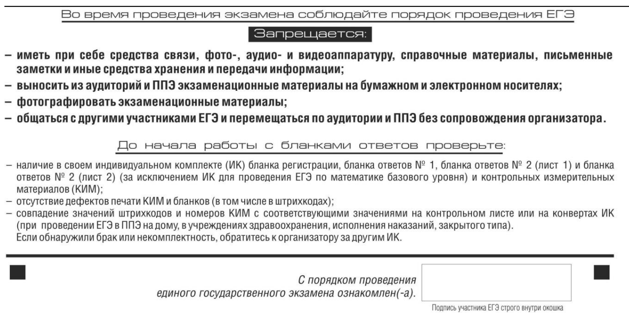
Рис. 4. Краткая памятка о порядке проведения ЕГЭ, краткая инструкция по определению целостности и качества печати индивидуального комплекта участника экзамена

В средней части бланка регистрации расположены краткая памятка о порядке проведения ЕГЭ, краткая инструкция по определению целостности и качества печати индивидуального комплекта участника экзамена (рис. 4) и поле для подписи участника экзамена об ознакомлении с порядком проведения ЕГЭ.