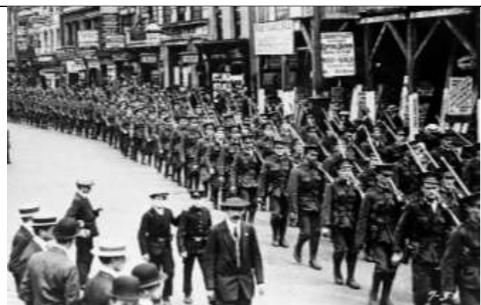
Илл. 6. Марш добровольцев в Лондоне, август 1914 г.