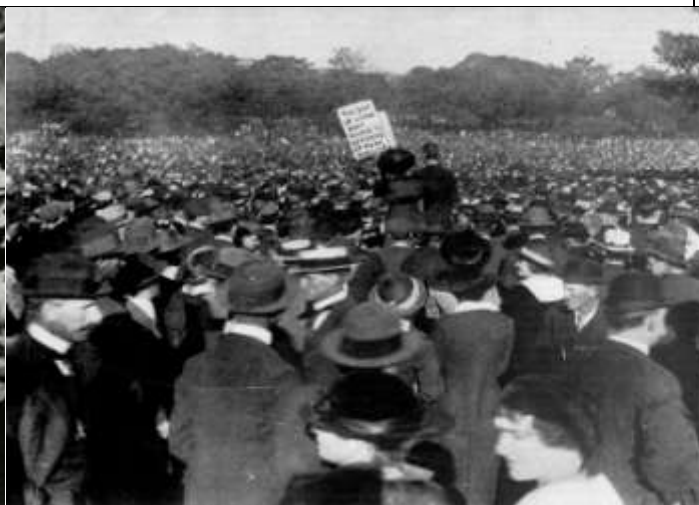
Илл. 11. Забастовка рабочих в Австралии, 1917 г.