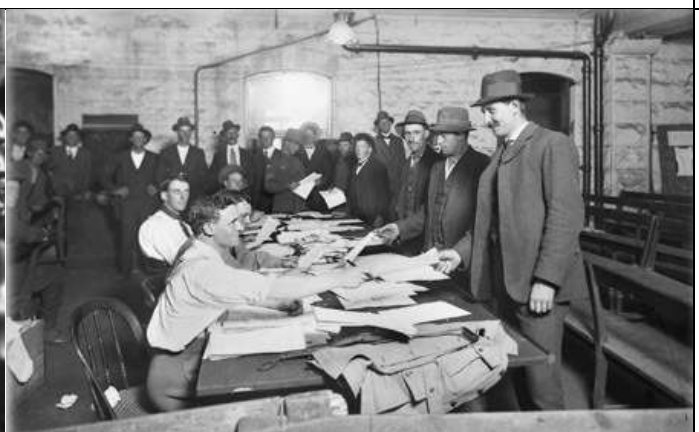
Илл. 5. Французские граждане на призывном пункте, август 1914 г.