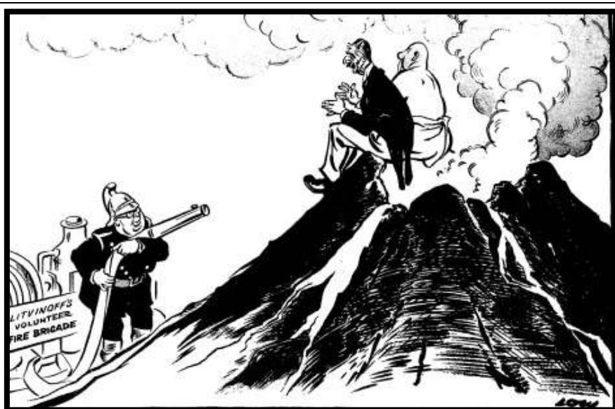
Илл. 5. Карикатура на ситуацию в Европе после аншлюсса Австрии, 1938 г.

аллегорические изображение Британской империи