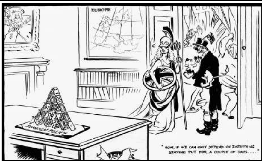
Илл. 4. Карикатура на внешнюю политику Н. Чемберлена, 1937 г.

Подпись к карикатуре: «Новый план внешней политики».