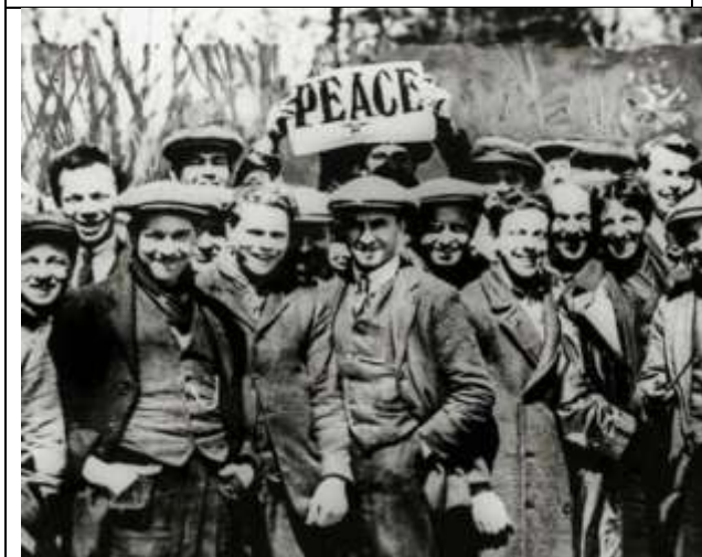
Илл. 10. Антивоенный митинг в Дортмуте, Англия, 1917 г.