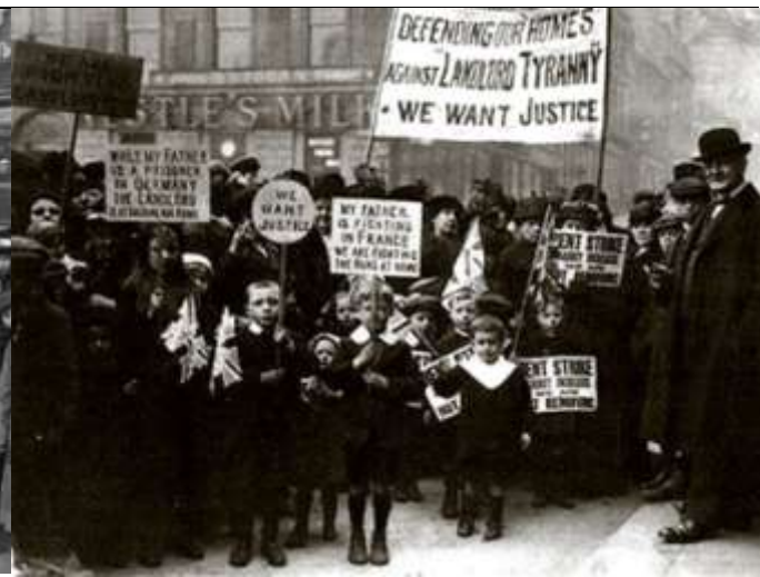
Илл. 9. Забастовка рабочих в Глазго, с требованием социальных реформ, 1916 г.