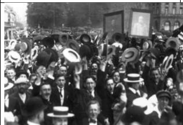
Илл. 4. Жители Берлина приветствуют объявление о начале войны, август 1914 г.