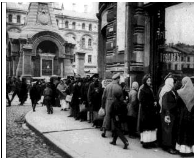
Илл. 7. Очередь у продовольственного магазина, Москва, 1916 г.