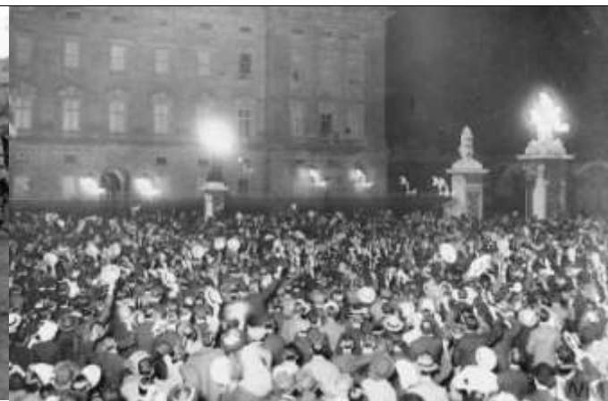
Илл. 3. Британцы перед Букингемским дворцом, приветствуют короля.