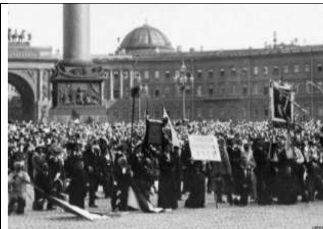
Илл. 1. Перед Зимним дворцом в день объявления войны, август 1914 г.