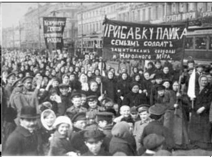
Илл. 8. Демонстрация женщин в Петрограде, 1917