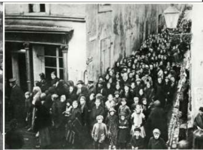
Илл. 12. Очередь за раздачей продовольствия в Берлине. 1917 г.