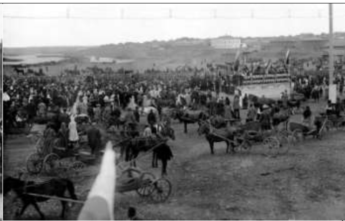
Илл. 2. Молебен о даровании победы, август 1914 г. Миасс, Оренбургская губерния.